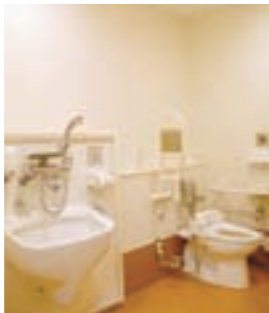
オストメイト対応トイレ

市では、10月18日(日) に開催する鹿屋市保健福祉 大会において、保健福祉の 発展に特に功績顕著な人の 顕彰を行います。 次に該当する顕彰候補者 がいらっしゃるいましたら、 推薦をお願いします。