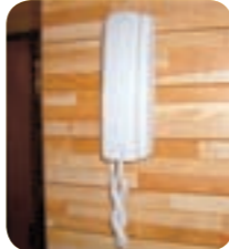
通話式インターホン