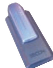
徘徊高齢者位置探索システム端末機