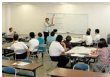
プロジェクト会議の様子