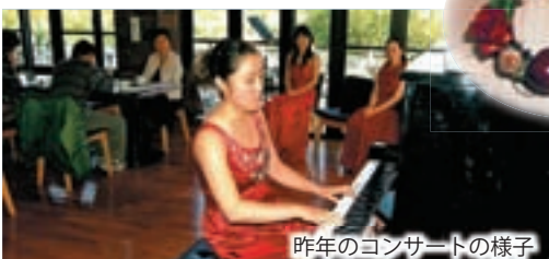
昨年のコンサートの様子

手作り講座で作った作品などを展示します。 日 時 12月13日（日）～20日（日） 10:00～16:30 場 所 多目的ホール ※持ち込み作品も受け付けます。