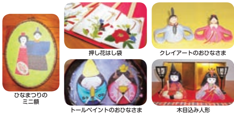
ひなまつりのミニ額