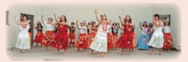
フラダンスサークルの成果発表