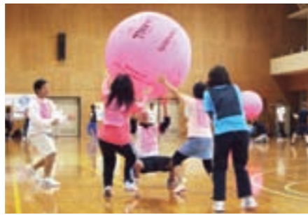
ニュースポーツ「キンボール」

●対象者 小学4年生以上 ●定員 50人程度(定員になり次第締め切り) ●参加費 500円(保険料) ※国際交流協会員は無料 ●応募方法 電話で応募するか、住所、氏名、生年月日、電話番号を記入のうえ、FAXでご応募ください。 ●応募期限 3月17日(水)