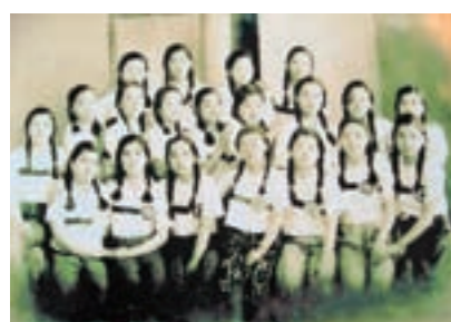
女子挺身隊通信隊

は、鹿屋航空基地と市民の歴史を再認識し、お互いの関係をさらに深めるため、「基地と大開くその真実」と題して新たな展示コーナーを設置します。 当時の第二十二海軍航空廠や第五航空艦隊司令部などに献身された女子挺身隊の活躍、昭和20年3月18日・19日の鹿屋空襲、旧野里小学校に駐留の特攻隊員との交流などの写真や資料、体験談などを募集します。 ご連絡いただければ直接お伺いしますので、市民の皆さんのご協力をお願いします。 【問い合わせ・連絡先】 市防衛協会青年部事務局 (鹿屋商工会議所内) ☎0994-42-3135