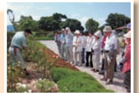
ばらの栽培教室の様子