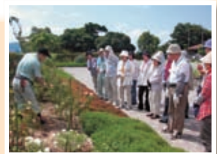
ばらの栽培教室の様子