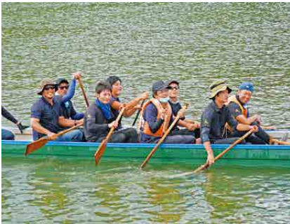
▲ドラゴンボート大会に出ている時の様子。

地元の誇りとして 輝北の和牛肉を 輝栄牛会とは、輝北町在住の肉用牛に関連する経営者を会員対象として、平成28年8月に設立されました。結成当初から輝北地域の畜産振興を目的に様々な活動を行っており、会員は繁殖業者や肥育経営者等で構成されています。各経営者が自信をもって飼育・出荷している輝北の和牛の市場価値向上を目標に、地元の企業や販売店に賛助会員として支援を頂きながら活動しています。 現在は祭りやイベント等に出店し、販売や振る舞いを実施しています。今年は、地域振興及び広報活動として、輝北ダムで開催されたドラゴンボート大会に選手として出場するとともに和牛肉の振る舞いも行いました。