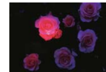
『スターローズ』 柚木 京子さん(始良市)