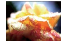
『輝く水玉』 吉村 スミ子さん(鹿児島市)