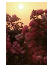
『朝光を浴びて』 税所 マリさん(鹿屋市)