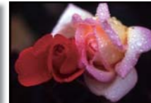
『雨のイリュージョン』 川畑 常子さん(鹿児島市)