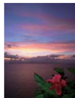
『癒しを求めて』 西柳 茂樹さん(鹿屋市)