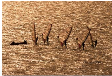
『ラインアップ』 三井 尉津夫さん(鹿屋市)