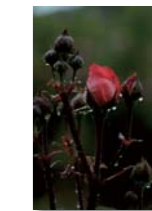
『珠玉の耀き』 木場 津代美さん(いちき串木野市)