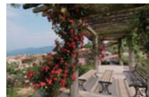
『憧れのローズガーデン』 篠原 さおりさん(霧島市)