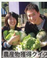
農産物獲得クイズ