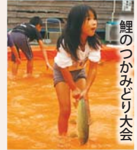
鯉のつかみどり大会