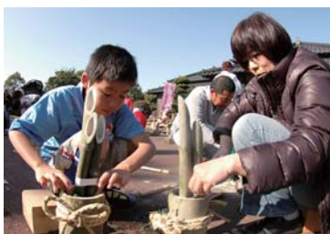
▲ミニ門松作り体験教室