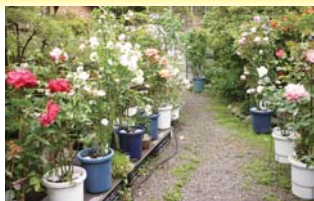
▲ばらいっぱいコンクール応募作品