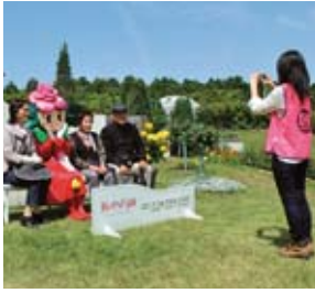
▲シャッター押し隊