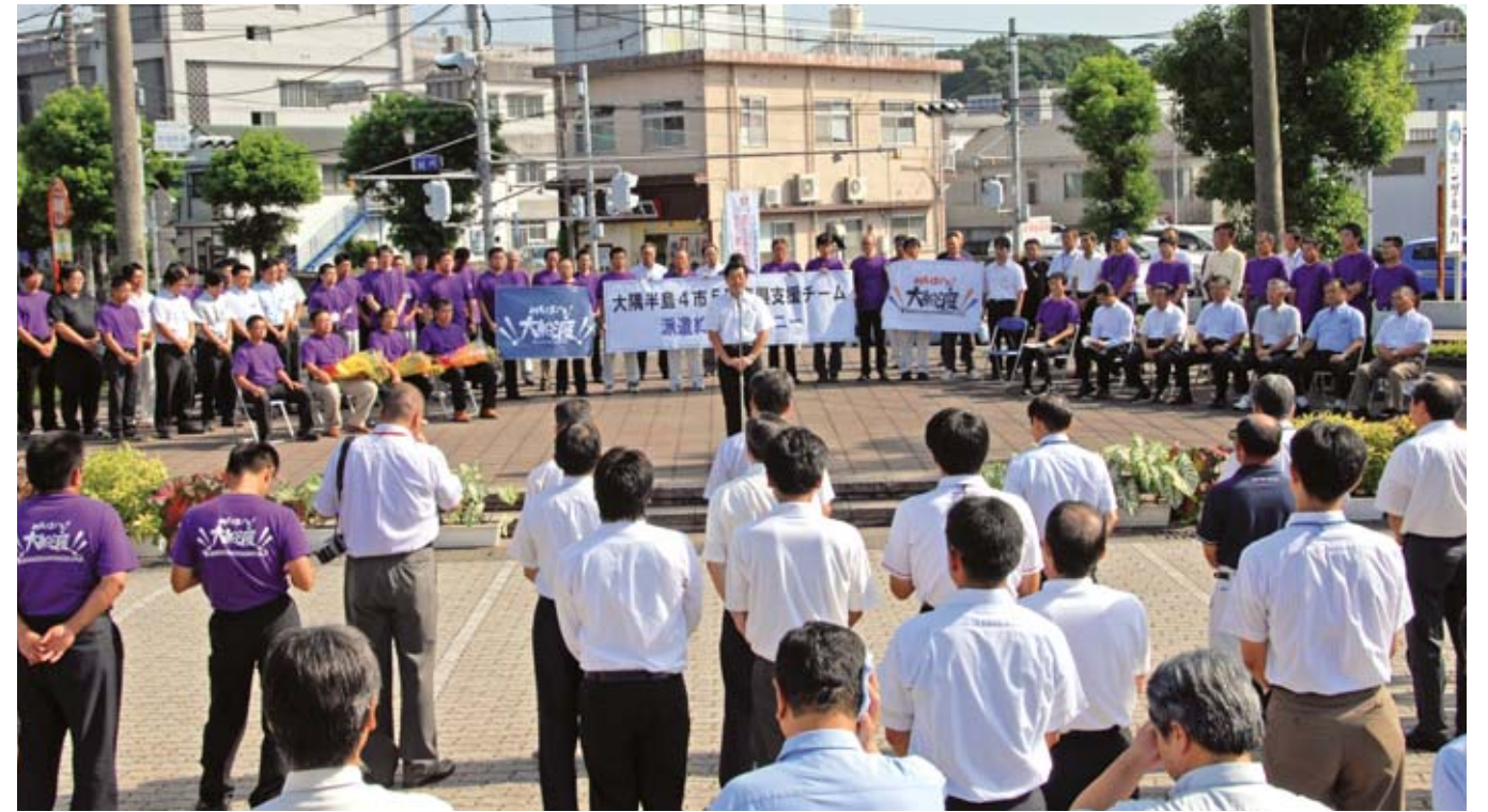
▲9月5日、市役所で大隅半島4市5町復興支援チーム派遣終了セレモニーが行われました。