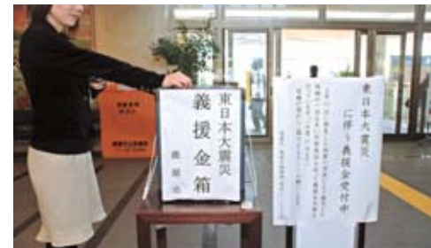
▲3月14日から8月31日まで、義援金箱を設置。多くの皆様からのご協力をいただきました。

■義援金の受付 市では、震災直後の3月14日から8月31日まで、市内9か所(本庁、各総合支所、各出張所)で義援金箱を設置し、市民の皆様から総額26,870,249円の温かい義援金が寄せられました。 寄せられた義援金は、20,788,129円を日本赤十字社鹿児島支部鹿屋地区(市社会協議会内)を通し、3回に分けて、被災地に寄贈させていただきました。 また、大隅半島4市5町復興支援チームにより鹿屋市が岩手県大船渡市を支援