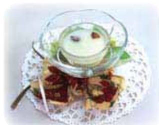
▲クリスマスアロマキャンドル