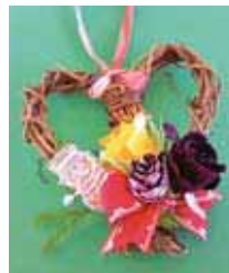
▲クリスマスリース