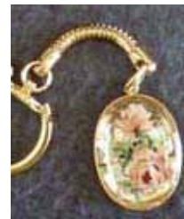
▲バラのキーホルダー