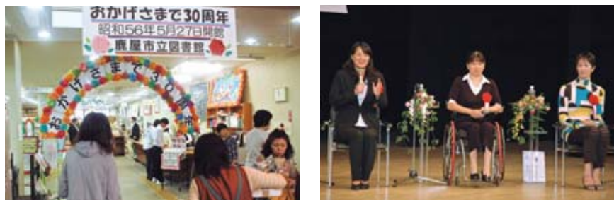
▲昭和56年5月27日に開館した鹿屋市立図書館が開館30周年を迎えました。現在、蔵書数が17万3千冊以上と、大隅半島最大の蔵書数となっています。