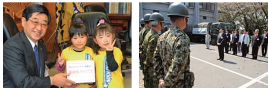
▲3月14日から8月31日まで、義援金の受付を行いました。多くの市民の皆さんの温かいご協力ありがとうございました。