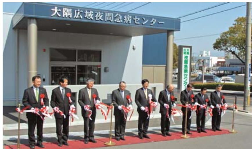
▲4月1日、鹿屋市役所北側の多目的駐車場内に、内科・小児科の夜間急病に対応する診療所として「大隅広域夜間急病センター」が設置されました。