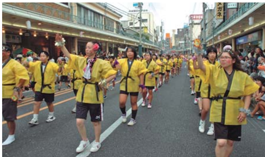
▲昨年、口蹄疫侵入防止のため、中止された各地の夏祭りが2年ぶりに行われ、多くの皆さんで賑わいました。