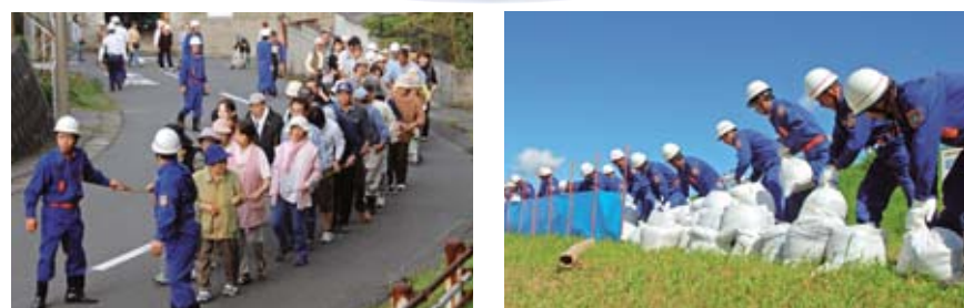
▲7月に吾平町馬込橋下流域で鹿屋市総合防災訓練が、11月には、東日本大震災を受けて、海岸沿いの高須町で鹿屋市津波避難訓練が行われました。