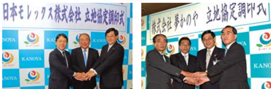
▲6月1日、株式会社夢かのやと、10月21日、日本モレックス株式会社と立地協定を締結しました。地域経済の活性化に大きく貢献するものと期待されています。