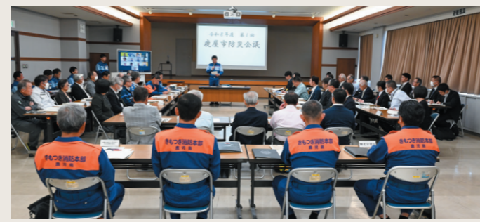
▲令和8年度 第1回鹿屋市防災会議の様子

4月27日、市役所で国土交通省や海上自衛隊、鹿屋市医師会など36団体による「令和8年度 第1回鹿屋市防災会議」が開催されました。 「明日、地震が発生したらどうするか」を念頭に入れた上で、市全体で防災に取り組むための具体的な施策について話し合われました。