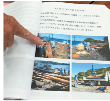
▲令和2年7月豪雨の災害記録

災害発生時、町民がどのような初動対応を行うかが重要であり、それを町全体で把握していることが大切だと考えています。