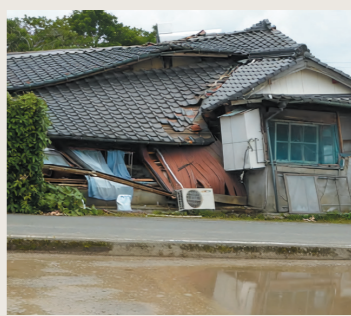
▲平成28年4月14日21時26分に発生した熊本地震の被害の様子

台風や豪雨災害の場合、事前に天気予報などで情報を取得し、準備することができますが、地震や火山の噴火、津波等は予想することができません。 平成28年4月14日に熊本地震、今年の4月20日には東北地方で北海道・三陸沖地震が発生し大きな被害をもたらしました。予期せず災害が起きたときにも「いつ」「だれが」「何をするのか」を家族で話し合い、備えをしておきましょう。