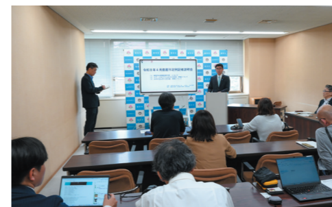
▲記者説明会の様子

これまで市長による記者説明会は年4回、議会定例会前に開催していましたが、今年度から原則として毎月開催します。あわせてその様子を市公式YouTubeなどで視聴できるようにしました。