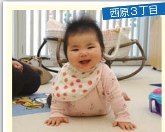
西原 3 丁目

仲よし 3 人組♥味方になってくれる大切な家族。みんな大好き♪ (パパ・ママより)