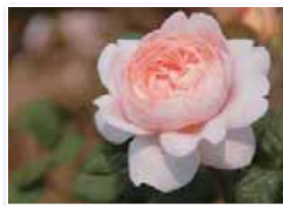
イングリッシュローズガーデン内