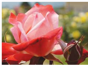
カラーガーデン内

花名は東京オリンピックに由来します。日本の品種登録第一号のバラで、開花とともに赤色が濃くなる姿はオリンピックの聖火台に火が灯されたようです。