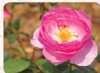
イングリッシュローズガーデン内

花は半八重でオープンカップ咲きのイングリッシュローズ。 花色は、初めは濃いピンク色で徐々に薄めのピンク色に変わります。 花名はひばりを意味します。