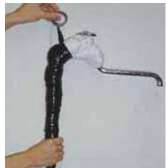
布が濡れないようビニールテープを下から上に全体を巻き上げ防水します。