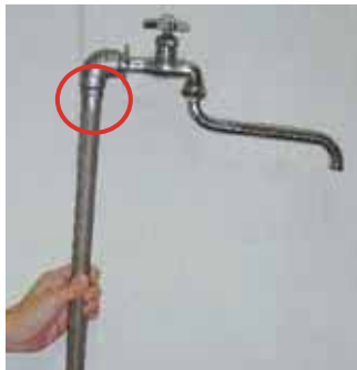
水道管がむき出しの蛇口は継ぎ目が割れやすいのです。