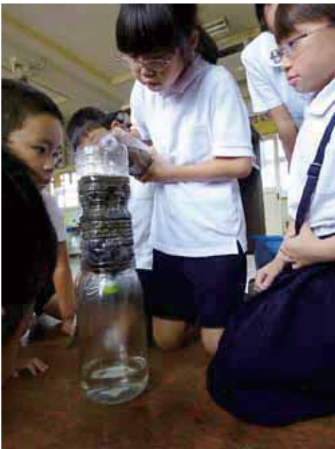
▲水がきれいになるかみんなで見守ります

昨年に引き続き、今年も市内小学生（主に4年生）を対象に水道教室を行いました。わたしたちが使う水道はどこからきて、どのようにつくられているのか実際に使われている水道管などを用いて説明しました。