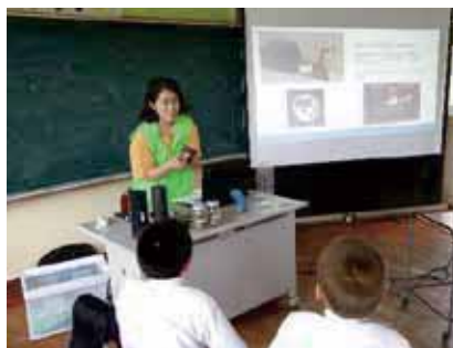
▲水道メーターの見方を学習しています