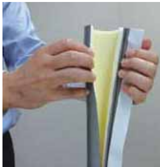
保温材はホームセンター等で購入できます。