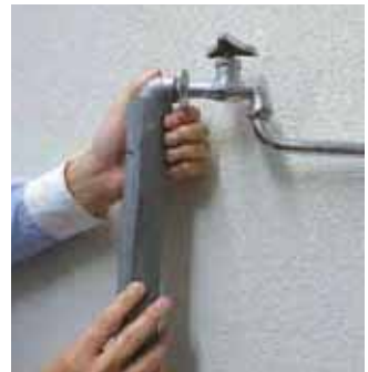
端の粘着テープを接着したら完成です。