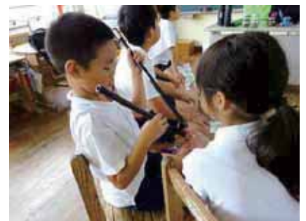
▲実物の水道管を触ってみました