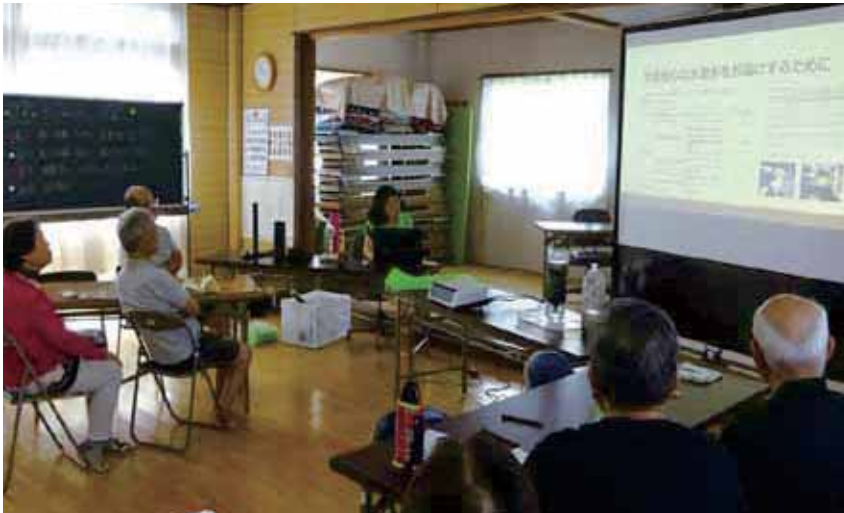
▲白崎デーサークルの皆さんが受講している様子

これからも安全安心な水道を目指し、市民の皆様が知りたい情報をわかりやすくお届けします。