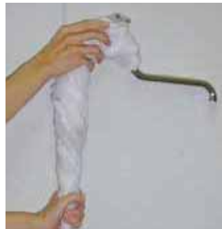
布で水道管全体を覆います