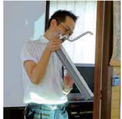
▲水道管凍結防止の仕方について保温材を巻いて説明しているところ