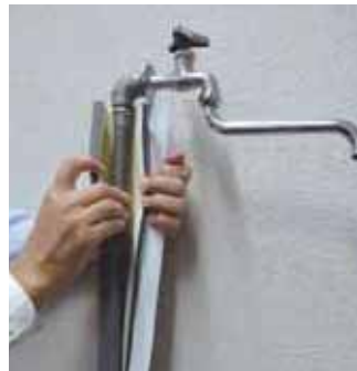
水道管を保温材で巻き込みます。