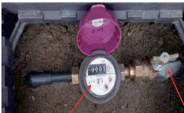
水道メーター（ふたにメーター番号が記載されています）