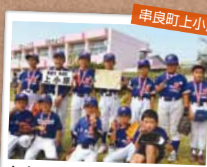
上小原ソフトボール スポーツ少年団

新入部員も3人増えて、12人となりました。試合で勝てるよう、元気に仲良く頑張っています。