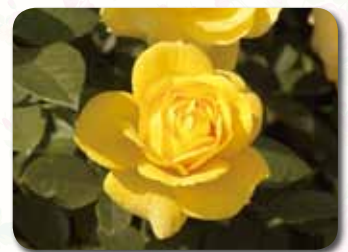
フェアリーガーデン内

春から晩秋まで咲き続け、耐寒性と耐暑性もそなえているため、初心者にも育てやすいバラです。