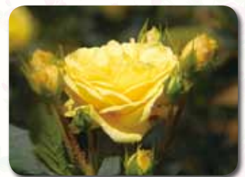
香りのガーデン内

黄色の小ぶりの花をすずなりに咲かせるバラです。丈夫で育てやすく、樹勢が良いためつるバラとしても使えます。花名の「ベル」はフランス語で「美しい」を意味します。