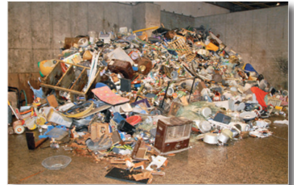
▲搬入された燃やせないごみ