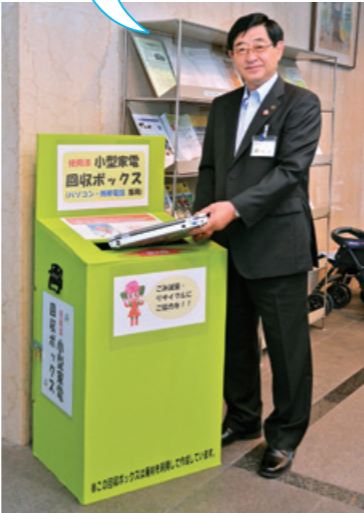
▲拠点回収ボックス