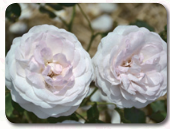
香りのガーデン内

花つきが大変よく、四季咲き性に優れたバラ。トゲが少ないため切花にも使いやすく、室内で飾ると柔らかい桜色の花が、明るく照らすぼんぼりの様です。