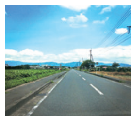
6/23：今日の鹿屋市の風景

6/29：阪神タイガース大和選手の応援に駆けつけた市長とガッチリ握手。この日、かのやファン倶楽部に入会していただきました。