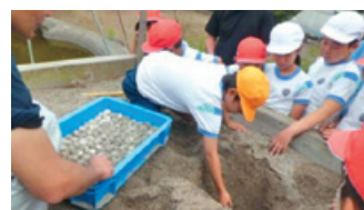
5/21：高須海岸にアカウミガメが上陸・産卵しました!!