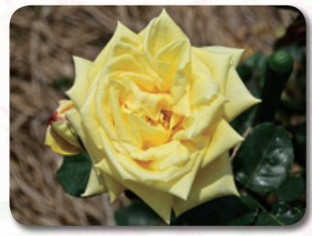
香りのガーデン内

竹取物語で有名な、かぐや姫の名前を冠したバラです。非常に強健、かつ香りの良い品種です。育てやすいので初めてバラを栽培される人にお勧めです。