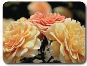
カラーガーデン内

スモーキーブラウンの柔らかな色合いで、ロゼット咲きのバラです。季節や環境で花色が変化します。花付きが良く、比較的幅をとらないため、鉢植えにもお勧めです。