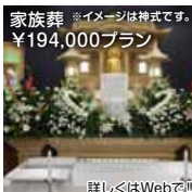
家族葬 ※イメージは神式です。