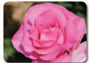
カラーガーデン内

元ビートルズのメンバー「ポール・マッカートニー」の名前を冠したバラ。香りが強く、生育が旺盛で、初心者でも育てやすいバラです。世界最多24個の賞を受賞。