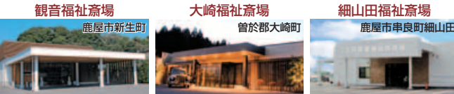
【最高に充実した親族控室】