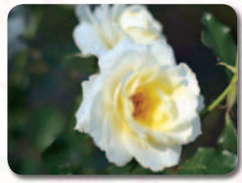
香りのガーデン内

花の中心に明かりを灯したような黄色が印象的なバラ。花が次々と咲き、花保ちが良いことも特長です。様々な花や雰囲気に調和し、「和音」を奏でるようです。