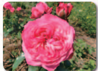
イングリッシュローズガーデン内

160枚もの花弁の色や形が、熱く吹き出る溶岩や八重咲きの桜を思わせるバラ。鹿屋生まれのこのバラは、高温多湿の気候や病気にも強く、また花保ちが良いのが特徴です。