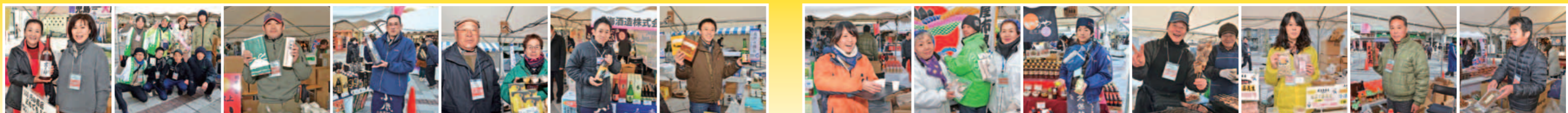
おおすみ食品(株) 鹿屋市茶業青年部「緑萌会」 (有)富久屋 小鹿酒造(株) 西ノ原園芸 大海酒造(株) (株)鹿屋大隅地域おこし公社 (株)オキス 鹿屋市漁業協同組合 久保醸造合名会社 (有)三清屋 三和物産(株) アグリ事業部 坪水醸造(株) (株)園田食品

今回、『かのやよかところフェアin大阪』に参加した、市内の14店舗の皆さんを紹介します。(順不同)