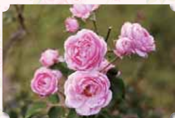
カラーガーデン内

明るい桃色の花があふれるように 咲き、目を惹くバラです。 丈夫で育てやすく、また、花が次々 と咲いてくるので、花壇での植栽に お勧めです。