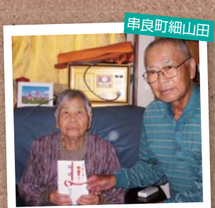
串良町細山田 川原園 イリエさん (100歳) 長生きの秘訣は、「家の周りを4~5回歩いて回ることと、食べ物の好き嫌いがなく、くよくよしないこと」だそうです。