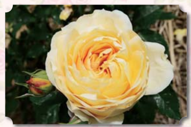
カラーガーデン内

心地よい香りのする大輪のバラで、ハニーイエローから杏を含んだ花色が魅力的な品種です。もともと切花に適した品種のため、アレンジメントにもお勧めです。