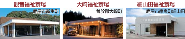
【最高に充実した親族控室】