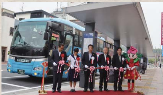
▲ 完成した鹿屋バス停留所