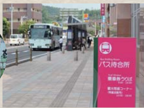
▲ バス待合所&乗車券販売所

問 三州自動車(株)鹿屋営業所 ☎ 0994-65-2258 (運行・乗車券販売等関係) 市政策推進課 (3階) ☎ 0994-31-1125