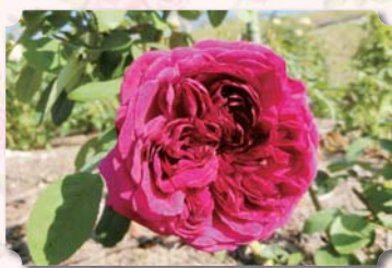
イングリッシュローズガーデン内

深みのあるクリームソーン色から味わいのあるパープルへと変化する気品に満ちた花を咲かせるバラ。花名は英国の劇作家シェークスピアにちなんで名付けられました。