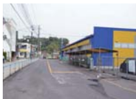
旧鹿屋バス停は、停車しません。

※詳細は、三州自動車(株)鹿屋営業所に問い合わせるか、市ホームページでも、確認することができます。