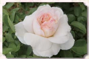
カラーガーデン内

中心部が濃いアプリコット色のく せのない優しい花色のバラ。 香りもあるクラシカルな大輪に育 ちます。また、半直立性のまとまり のよい株に育ちます。