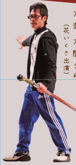
大楽大開さん (花いくさ出演)

国民文化祭に触れ合うことで、この気持ちや鹿児島島の良さを改めて知って欲しいと思います。