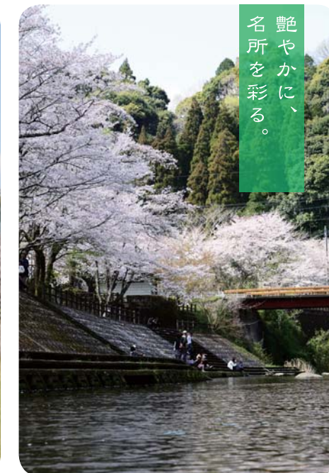
県民健康プラザ広場