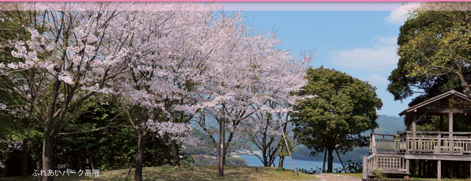
ふれあいパーク高隈