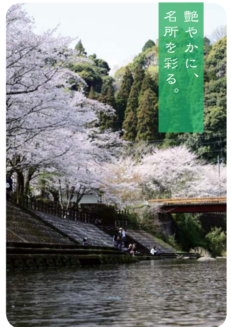
県民健康プラザ広場