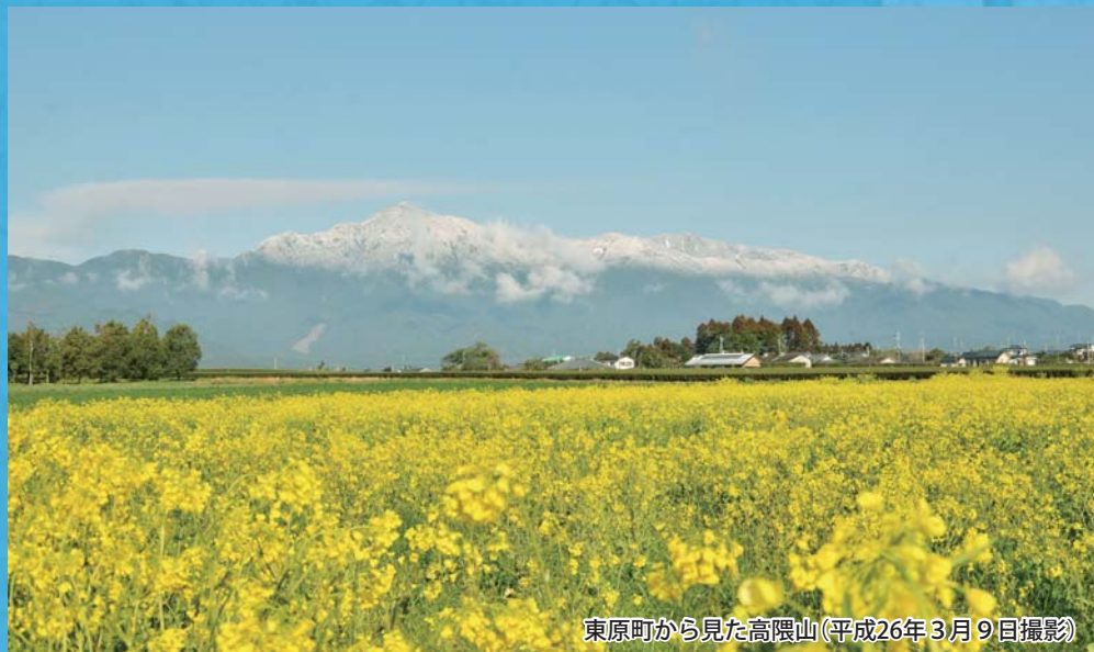
東原町から見た高隈山(平成26年3月9日撮影)