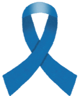
北朝鮮日本人拉致被害者救出活動のシンボルマーク「ブルーリボン」

これは、北朝鮮当局による人権侵害問題に関する国民の認識を深めることを目的に、平成18年6月に施行された「拉致問題その他北朝鮮当局による人権侵害問題への対処に関する法律」によって制定されました。これを機会に、北朝鮮当局による拉致などの人権侵害問題に対する認識を深めましょう。