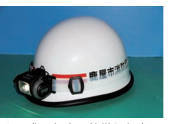
▲平成27年度に整備した鹿屋市消防団員のヘルメット（ヘッドライト付き）