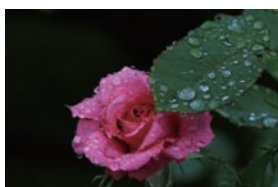
▲ フォトコンテスト2015 「ばらの部」グランプリ 「悲しみは分かち合い」