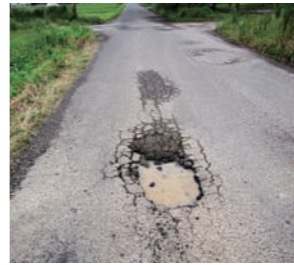
▲道路の損傷(穴ぼこ)

もし道路上に穴ぼこ等の損傷を発見した時は、市道路建設課(夜間・休日等は☎0994-43-2111)又は道路緊急ダイヤル(☎9910)へ至急ご連絡ください。