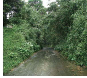
▲道路への樹木の張り出し

このことが原因で事故が発生した場合、所有者・占有者の責任を問われる場合があります。土地所有者は樹木の伐採や枝払い、設置物の撤去を行う等、速やかな対応をお願いします。