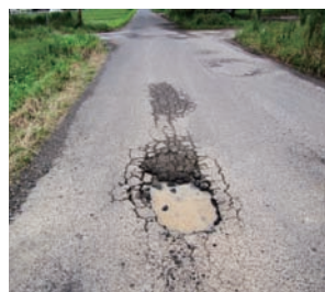
▲道路の損傷(穴ぼこ)

もし道路上に穴ぼこ等の損傷を発見した時は、市道路建設課(夜間・休日等は☎0994-4312111)又は道路緊急ダイヤル(#9910)へ至急ご連絡ください。