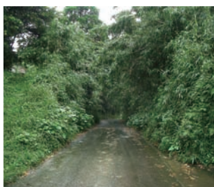
▲道路への樹木の張り出し

このことが原因で事故が発生した場合、所有者・占有者の責任を問われる場合があります。土地所有者は樹木の伐採や枝払い、設置物の撤去を行う等、速やかな対応をお願いします。