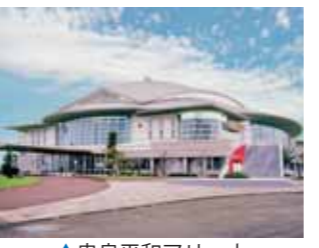
▲串良平和アリーナ