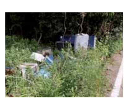
▲不法投棄されたごみ