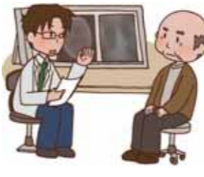
◎市保健相談センター